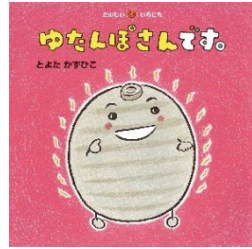
ゆたんぽさんです。 とよたかずひこ // さく え 童心社