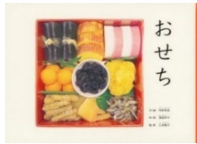
おせち 内田有美 // 文 絵 満留邦子 // 料理 三浦康子 // 監修 福音館書店