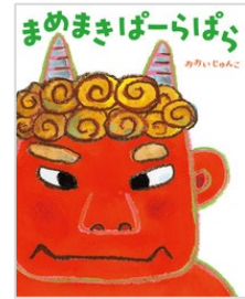
まめまきばーらばら おおいじゅんこ // 作 ほるぷ出版