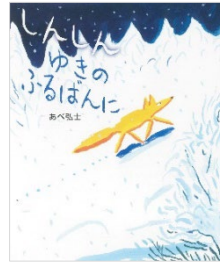
しんしんゆきのふるばんに あべ弘士 // 作 絵 ひかりのくに